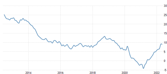
Chart 1.1 Pertumbuhan Kredit Indonesia (BI, tradingeconomics )