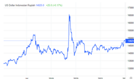
Grafik 1.2 Pergerakan Nilai Tukar Rupiah Terhadap US Dollar (tradingeconomics)