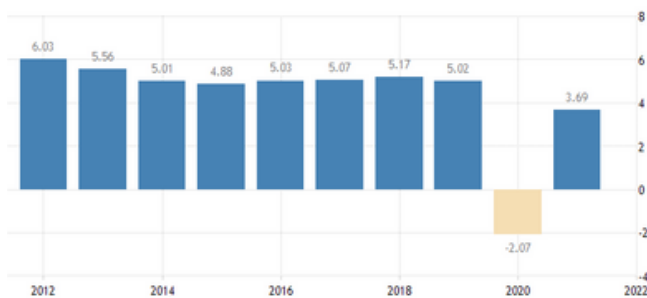
Grafik 1.1 Pertumbuhan Tahunan Ekonomi Indonesia (BPS, tradingeconomics)