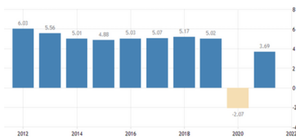
Grafik 1.1 Pertumbuhan Tahunan PDB Indonesia (BPS, katadata)