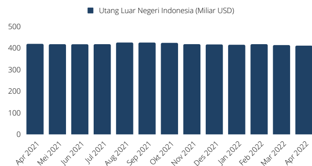
Grafik 1.1 Utang Luar Negeri Indonesia (Bank Indonesia)